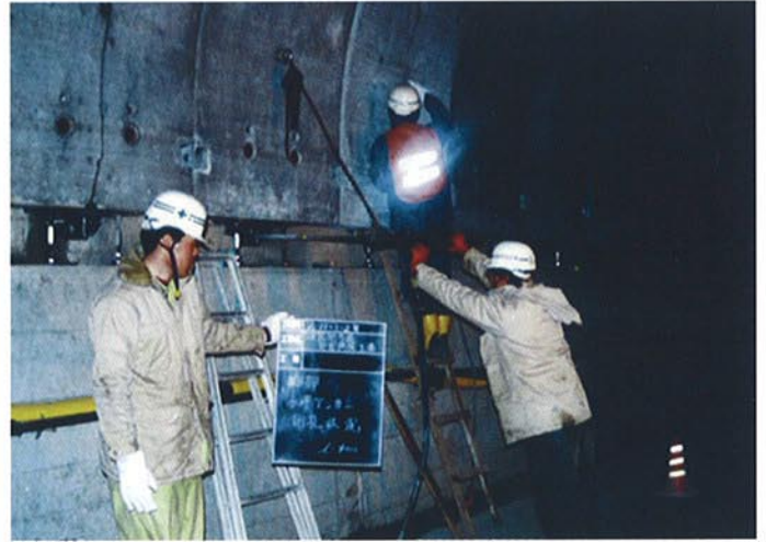
●水平アンカー孔削孔状況