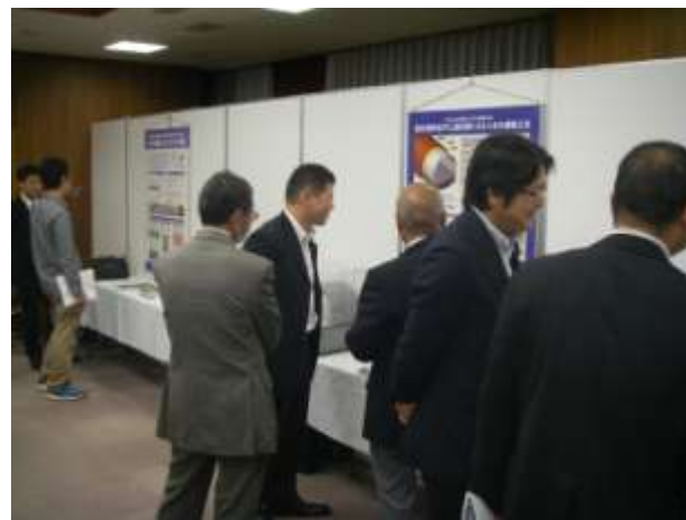
展示・技術相談コーナーの状況