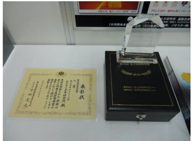
展示ブースの状況