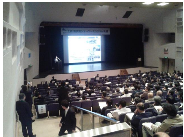
発表会場&展示ブースの様子