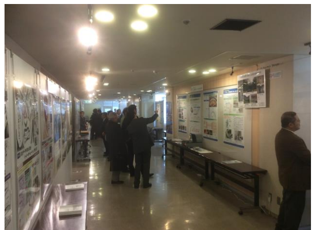
ブース来訪者への対応